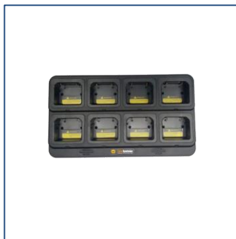
Caricabatteria da tavolo multiplo (8 in 1)

Per una maggior libertà delle mani, è possibile agganciare il proprio TE390 alla cintura con l'apposita Clip in dotazione, ed utilizzare un microfono altoparlante remoto o un microfono auricolare.