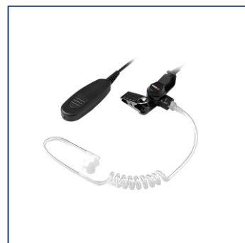
Kit 2-wire acoustic tube

Per maggiori dettagli tecnici, consultare il Data Sheet del Costruttore a questo link