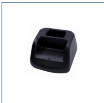
Caricabatteria da tavolo singolo

Per ricaricare l'LWP Phone, è possibile ricorrere a un caricabatteria da tavolo, disponibile in due versioni: singolo, da assegnare al terminale, sia esso ad uso individuale o condiviso, e multiplo, per ricaricare in un'unica postazione l'intero parco terminali (fino a otto dispositivi contemporaneamente).