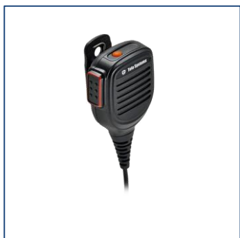
Microfono altoparlante remoto

Per una maggior libertà delle mani, è possibile agganciare il proprio TE390 alla cintura con l'apposita Clip in dotazione, ed utilizzare un microfono altoparlante remoto o un microfono auricolare.